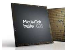
联发科 Helio G95 移动处理器发布：八核架构，号称其最强游戏芯片