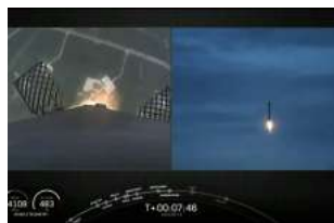
51年来第一次！美国向南方发射火箭