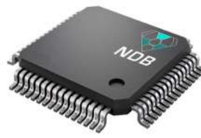
新能源初创企业NDB完成纳米金刚石电池概念验证测试：使用期可达2.8万年