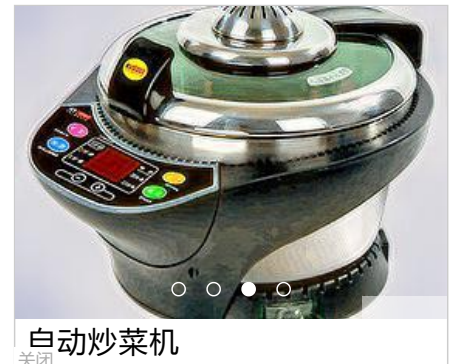
自动炒菜机 关闭 关闭