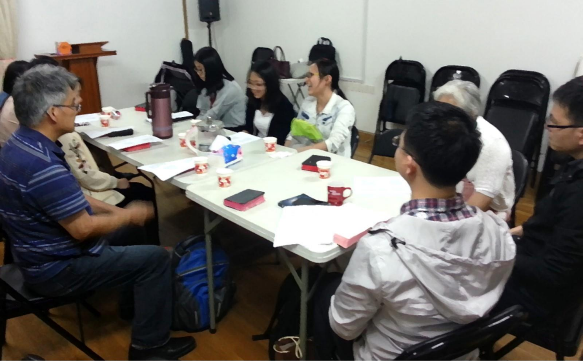
上海的海归学生参加的查经小组 May 2017