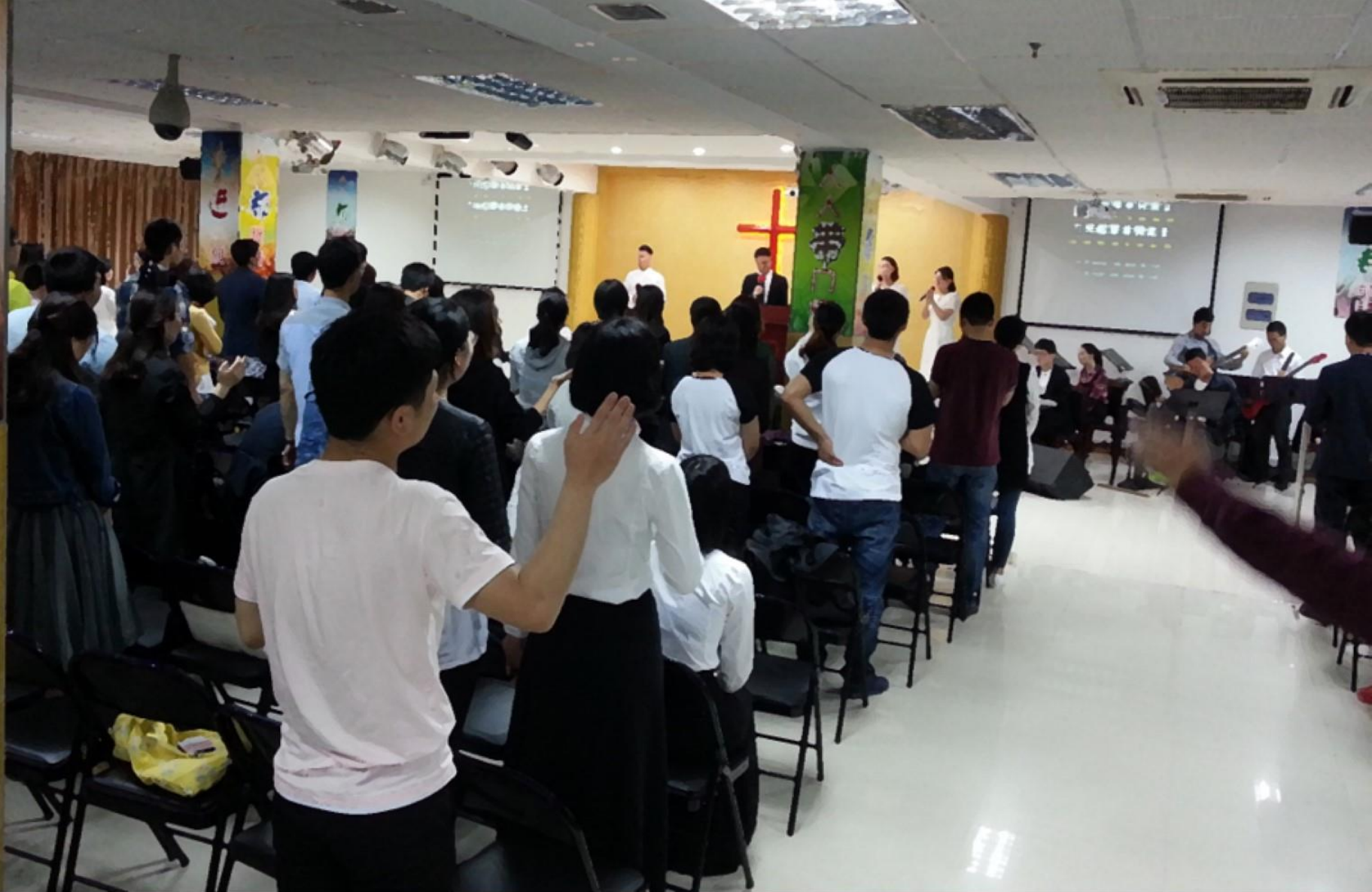
上海大学生家庭教会 May 2017