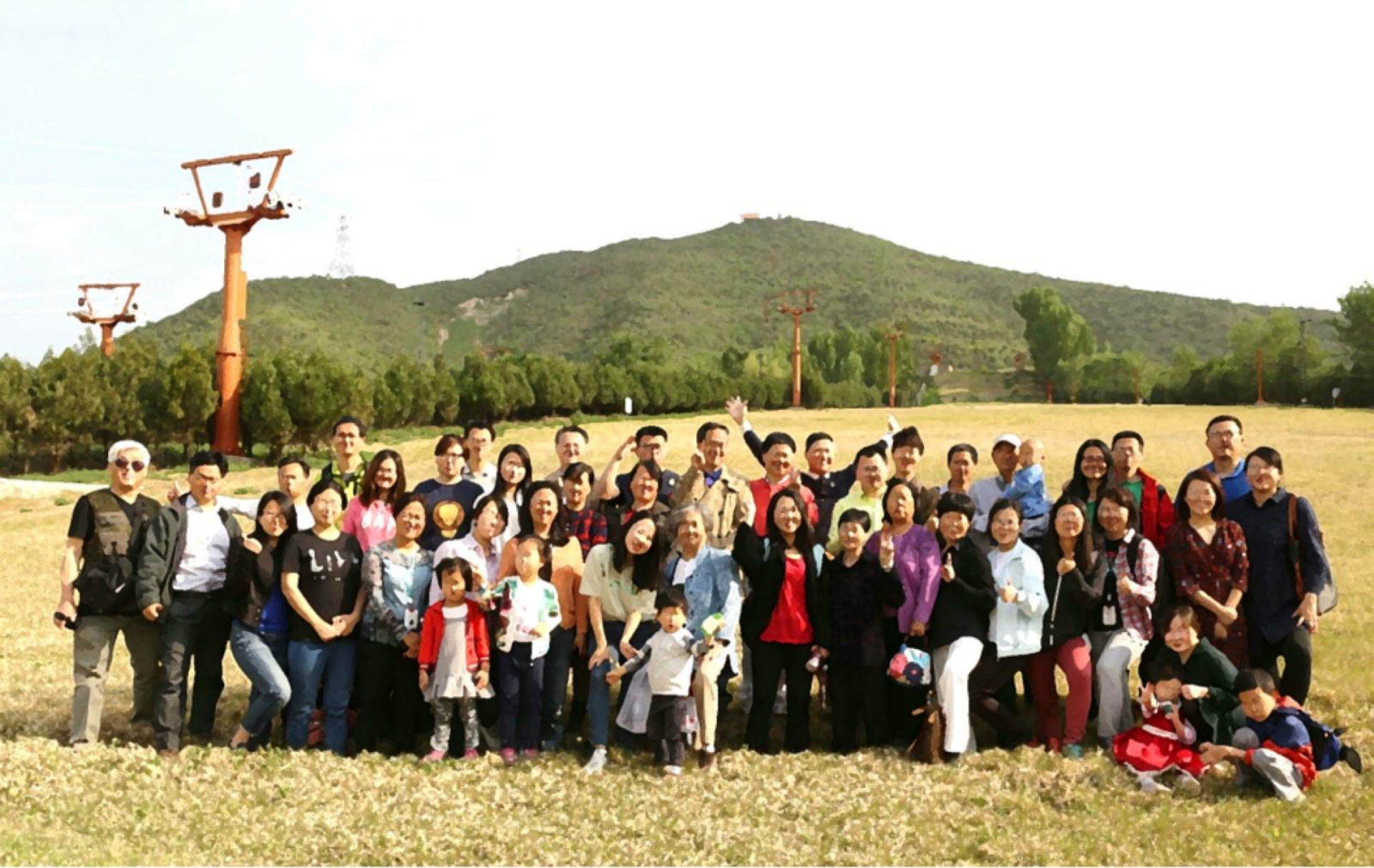
北京“神归”教会有20多位教授, May 1, 2017